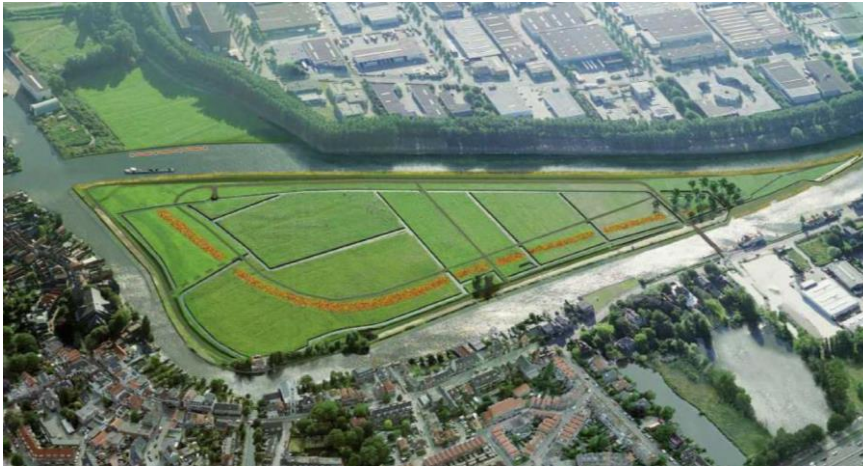
Afbeelding 2 Delftse Schie na de bochtafsnijding 3

Door deze vaarweg hoeven schepen niet meer door 2 haakse bochten in de Delftse Schie te varen. De oude vaarweg blijft bestaan maar wordt door de provincie overgedragen aan de gemeente Rotterdam. De oude vaarweg maakt geen onderdeel meer uit van de doorgaande vaarroute.