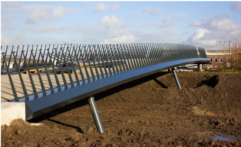
Afbeelding 3 deel van de brug op poldereiland 13